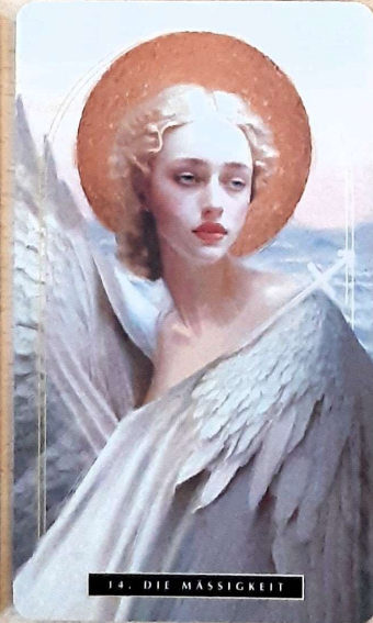
14. DIE MÄSSIGKEIT