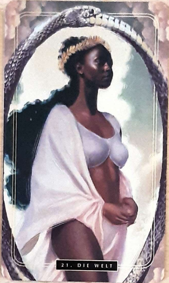
21. DIE WELT