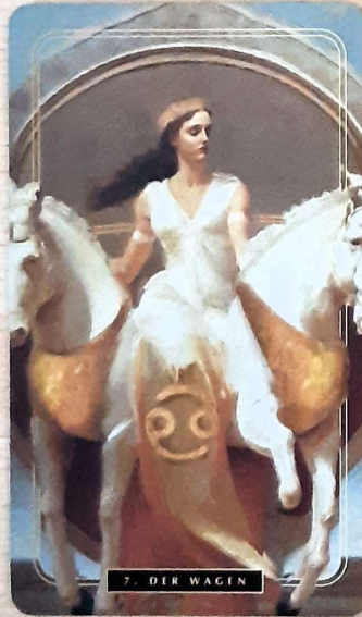
7. DER WAGEN