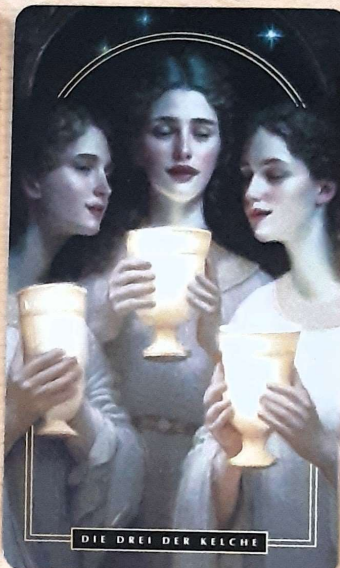
DIE DREI DER KELCHE